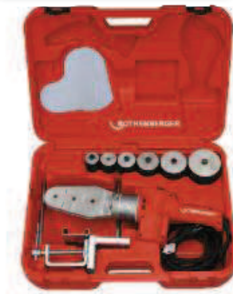
P 63 S-6, regolazione elettronica