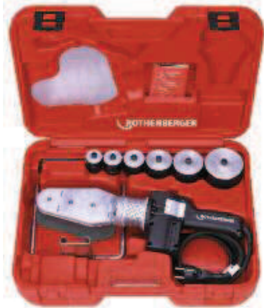
P 63 S-6, regolazione termostatica

Regolazione elettronica per una temperatura costante!