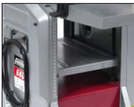
Indicazione micrometrica altezza piallatura Indication de l'hauteur de rabotage