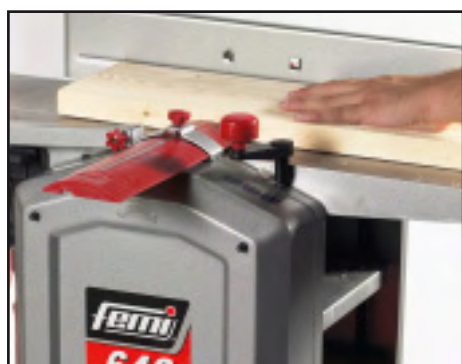
Piallatura a filo Travail de dégauchissage