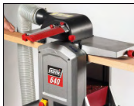
Piallatura a spessore Travail de rabotage